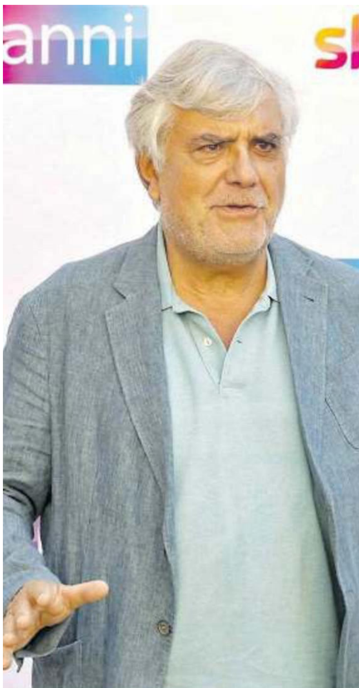
MAGISTRATO E BESTSELLERISTA Giancarlo De Cataldo, 69 anni

GIANCARLO DE CATALDO UNA STORIA SBAGLIATA EINAUDI PAGINE 136 EURO 15,50