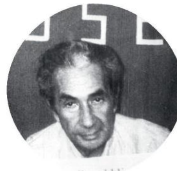
ⓘ Aldo Moro rapito dalle Brigate Rosse nel 1978. Sopra: particolare della cupola di san Pietro